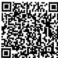
เอกสารแนบ