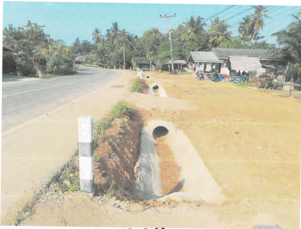
งานแล้วเสร็จทั้งโครงการ