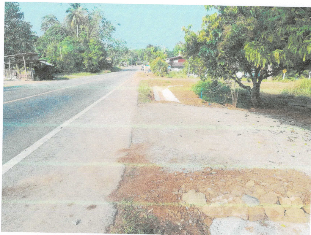
งานแล้วเสร็จทั้งโครงการ