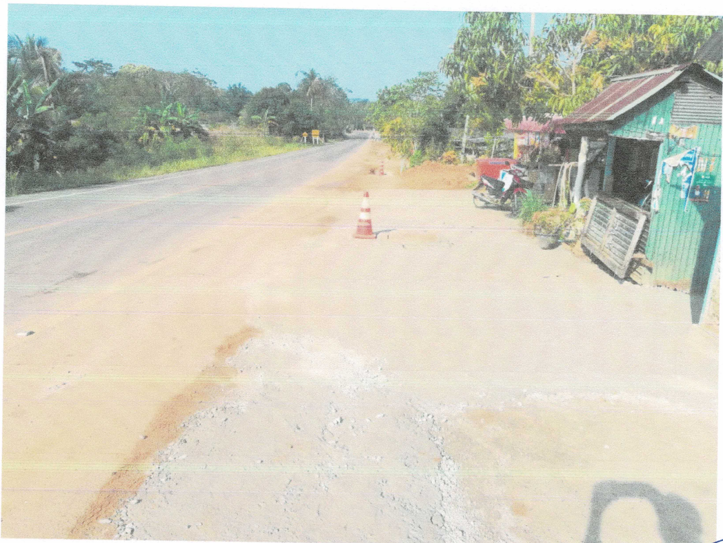
งานแล้วเสร็จทั้งโครงการ