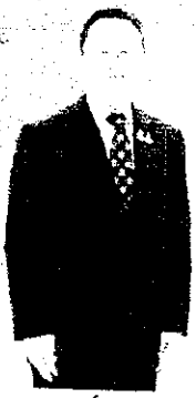
สมศักดิ์ กงสุภิน รองอธิบดีว่าการการทะเบียนราษฎร